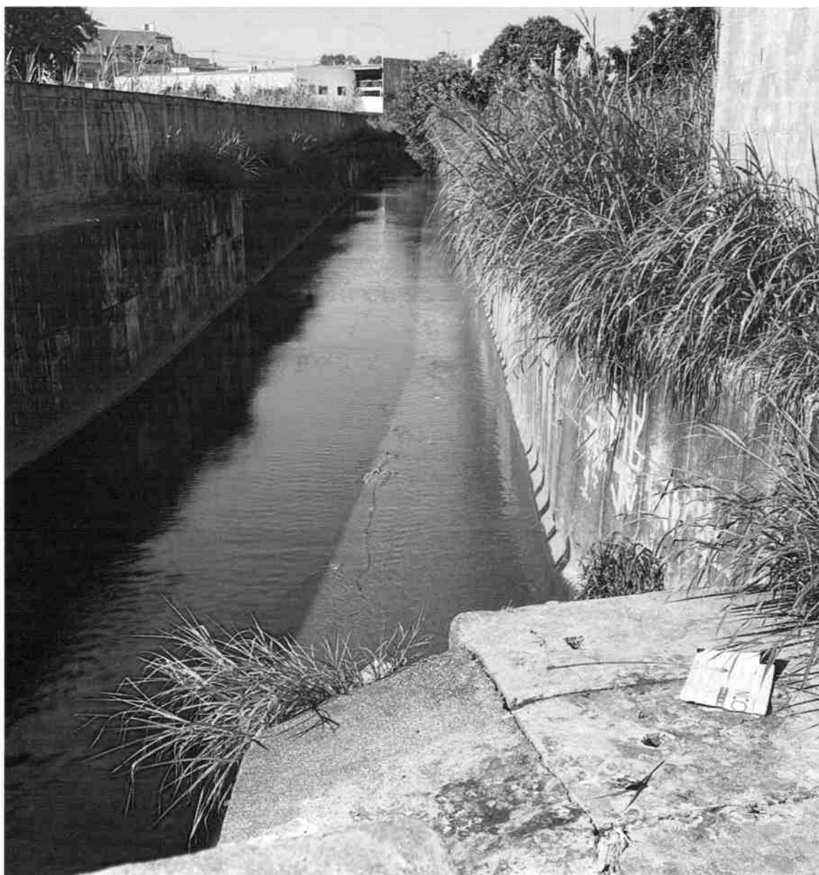
ROÇAGEM E LIMPEZA DO CÓRREGO LOCALIZADO NA AV. ANCHIETA AO LADO DO N° 799, BRAZ CUBAS – MOGI DAS CRUZES.